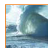
Resistente al agua