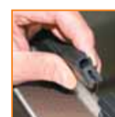
Montaje y mantenimientos de juntas