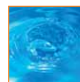
Resistencia al agua